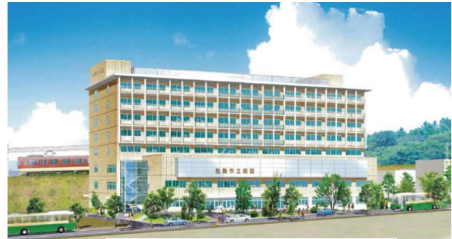
<新病院完成予想図>